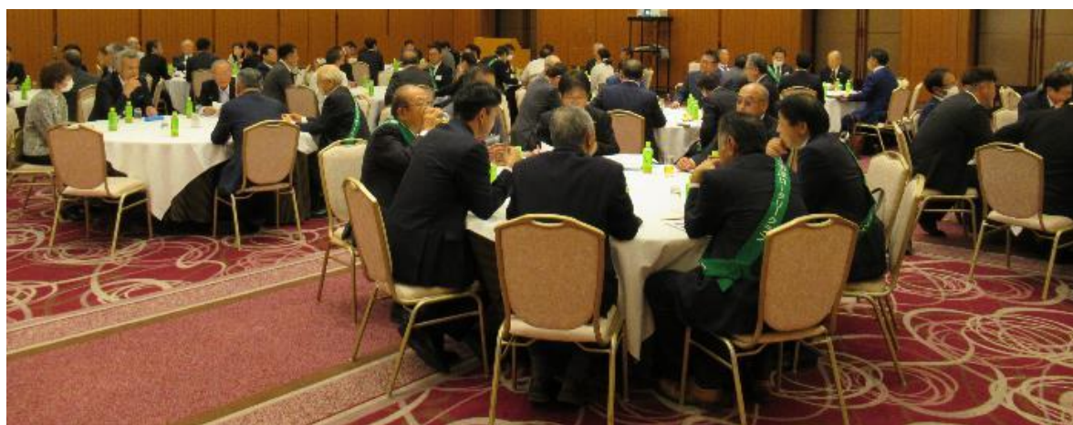
市原ロータリークラブ情報研修会出席者