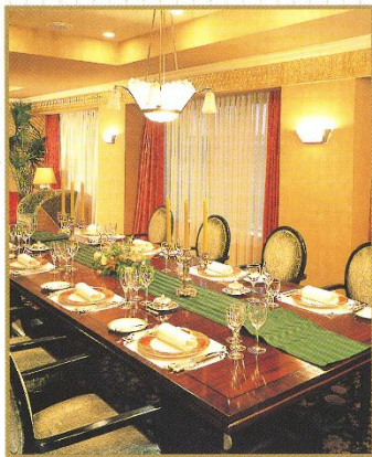
テーブルマナーのしおり