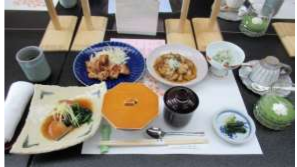
山崎会員 ご寄付ありがとうございます。