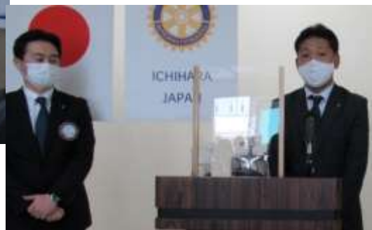
檜原会員とは同期入社だそうです。