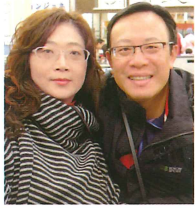
臺北市天和扶輪社