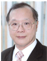
台北市西南區扶輪社