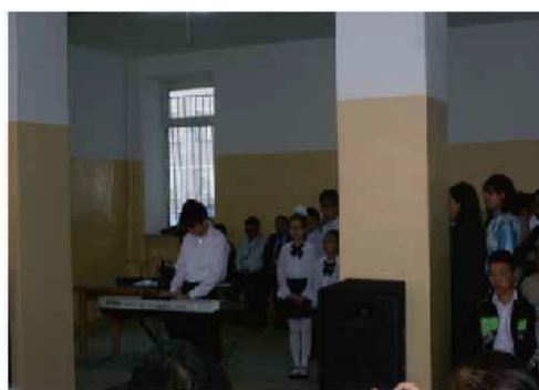
子供達からピアノ演奏と歌のプレゼント