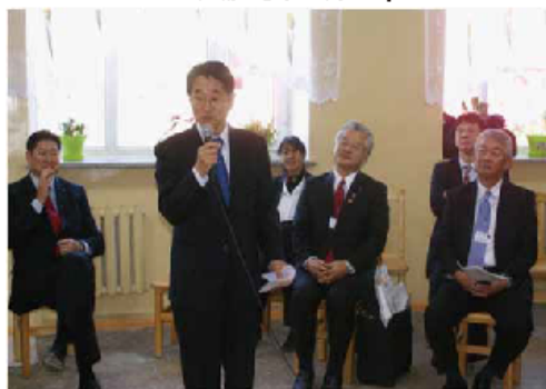
在モンゴル日本大使館 清水全權特命大使様ご挨拶

・プロジェクト実施予定額 3,500 ドル ・DG配分予定額 168,300 円 (1,700 ドル)