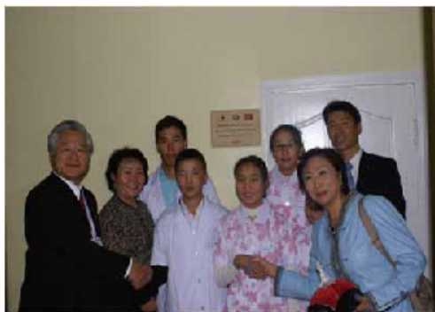
子供達とマッサージ教室の前で