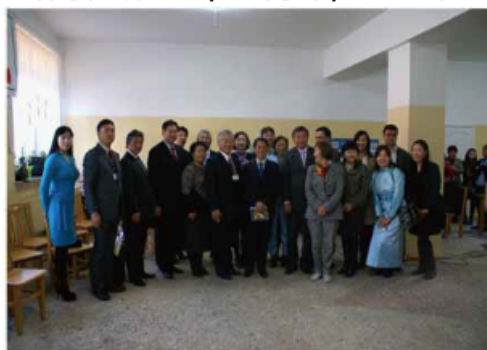
プロジェクト関係者の全体写真