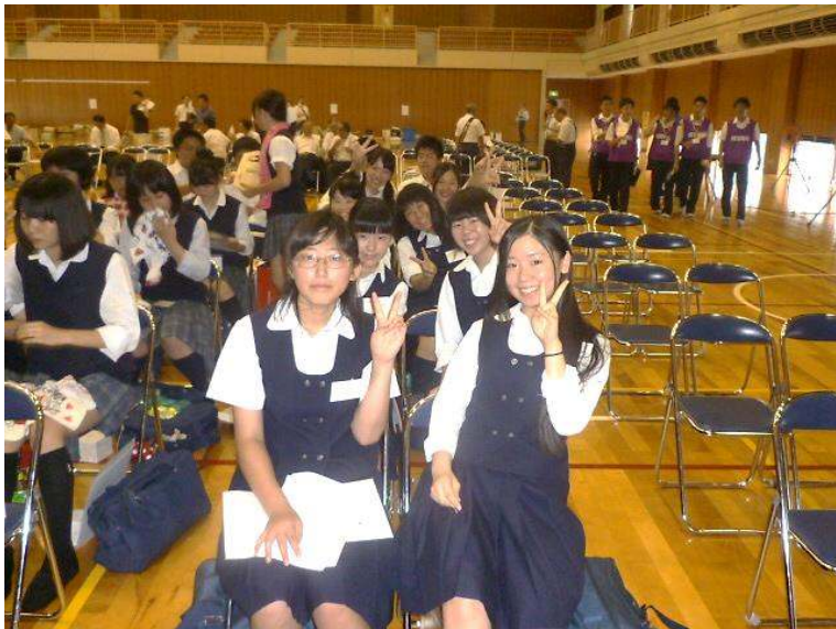
開会前の市原中央高校の生徒