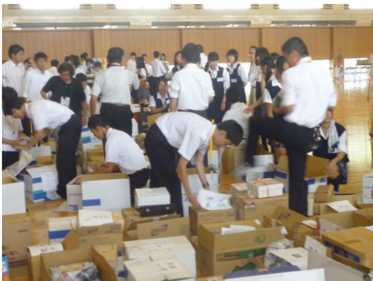
支援物資の仕分け・梱包作業中の生徒