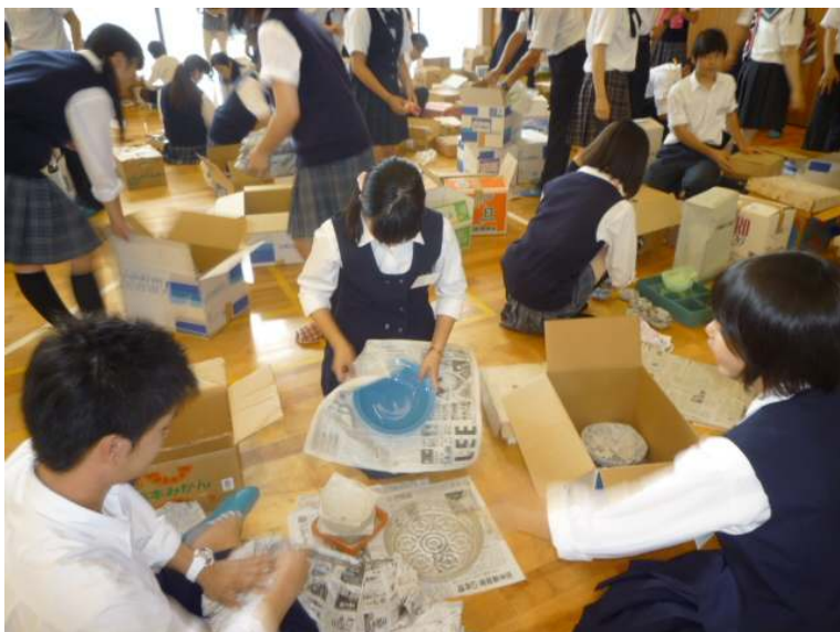
支援物資の仕分け・梱包作業中の生徒