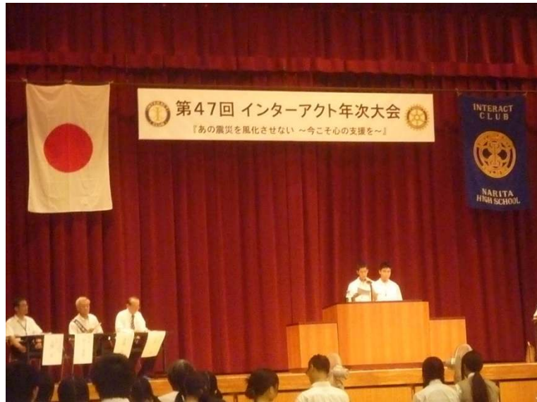
第47回インターアクト年次大会