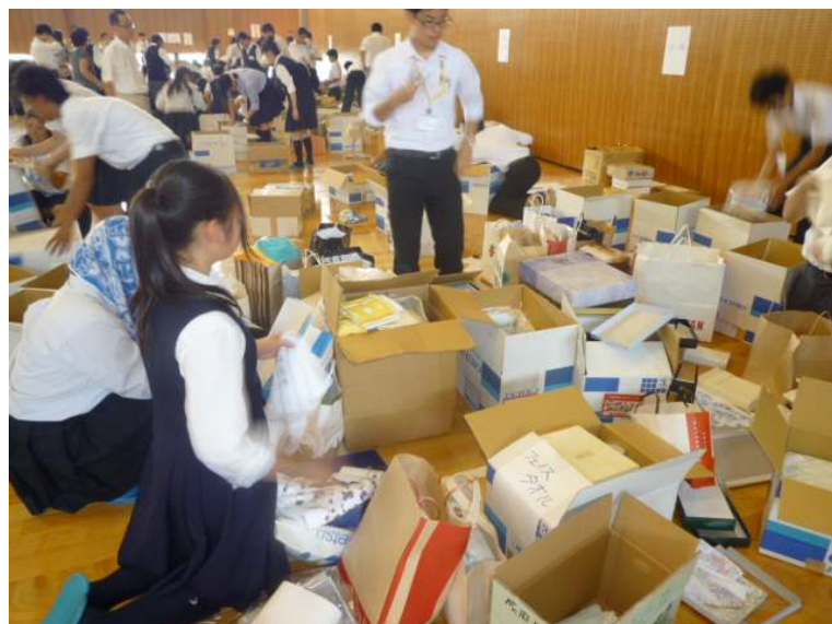
支援物資の仕分け・梱包作業中の生徒